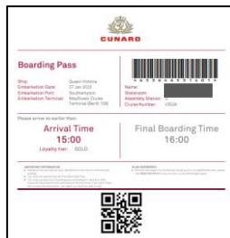
ボーディングパスイメージ